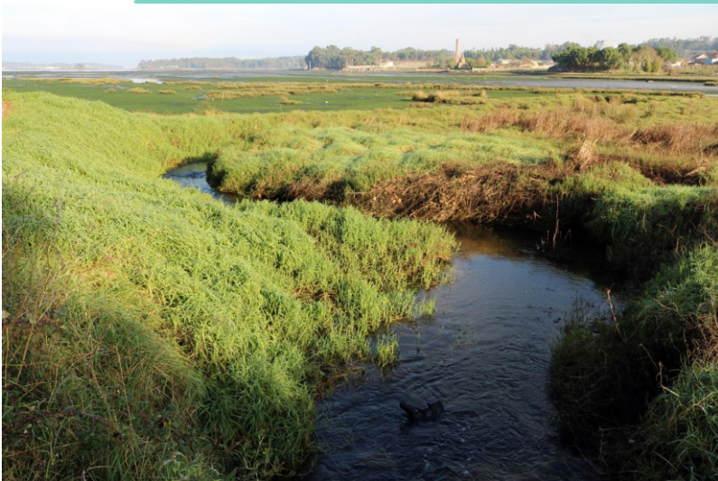
4-Rego Trilleiro. Marca o linde con Sanxenxo.