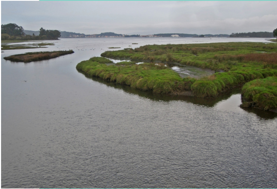
3-Esteiro do río da Chanca