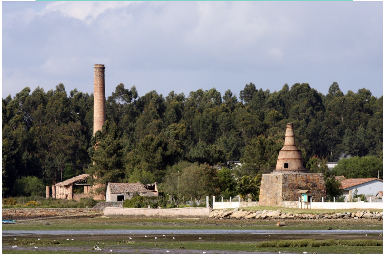
2-Seixiños. Antiga fábrica de cerámica e telleira de Noia.