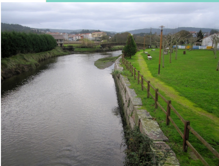
Río da Chanca: paseo e muíño