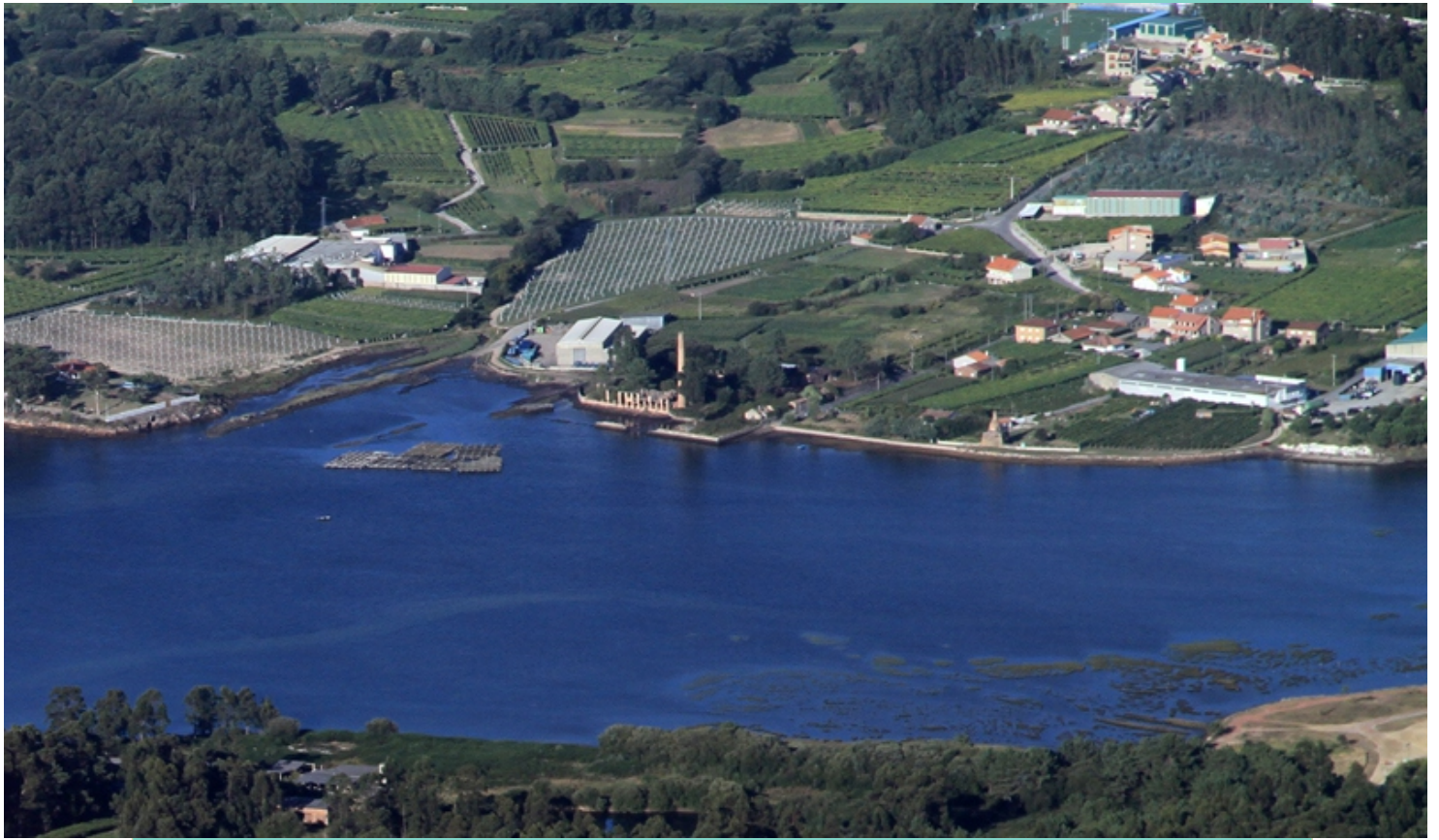
1-Rego do Francón e costa de Seixiños