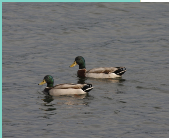
Lavancos no esteiro do río da Chanca